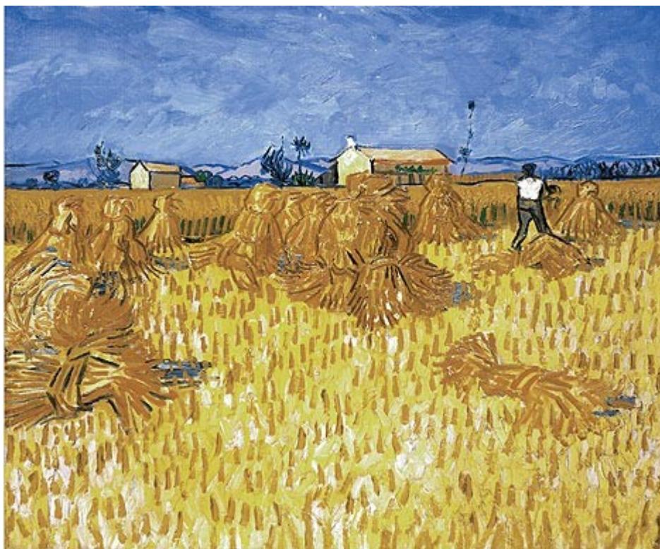
Campo de trigo en Provenza - Vincent Van Gogh

A partir de las imágenes, producir textos contando la vida de los trabajadores que aparecen en las obras.