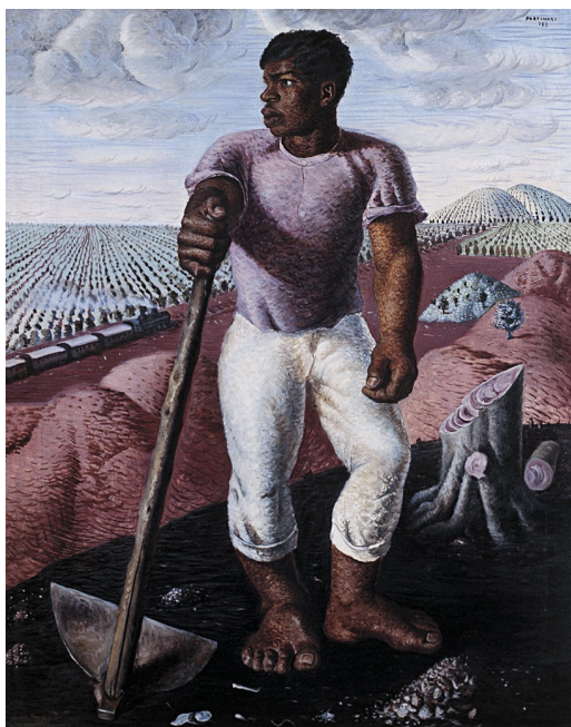
Descanso del sembrador - Cándido Portinari