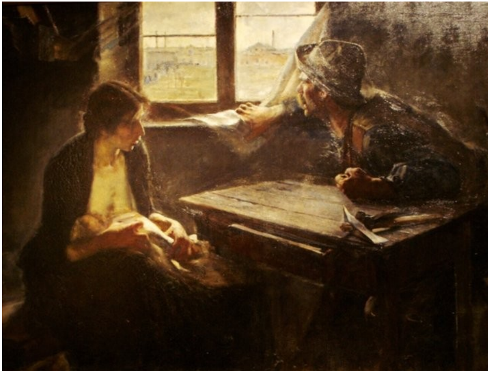
Sin pan y sin trabajo - Ernesto Della Cárcova