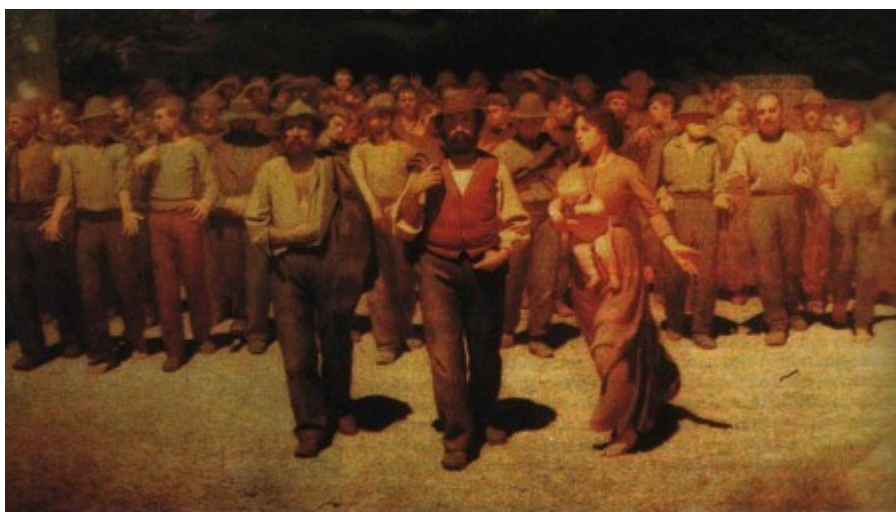
Il quarto stato - Giuseppe Pellizza da Volpedo