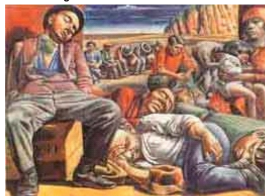
Antonio Berni. Desocupados. 1934

→ Organizar un recorrido por las distintas instalaciones de la escuela y si las condiciones institucionales lo permiten, una salida por el barrio de la escuela con el propósito de que lxs alumnxs capturen el mundo del trabajo presente en el entorno. De esta manera se generarán conocimientos nuevos sobre el tema.