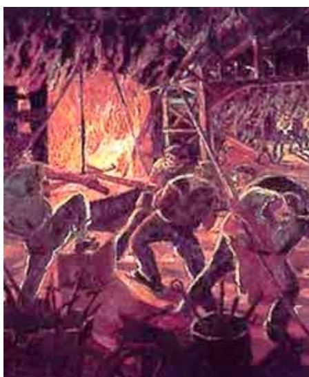
Benito Quinquela Martín. Fundición de acero