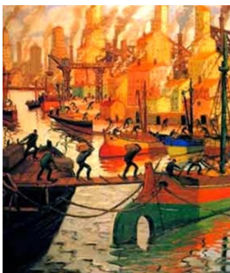
Benito Quinquela Martín. Elevadores a pleno sol. 1945

→ Los más pequeños pueden observar el video Zamba - Excursión al Museo de Bellas Artes: Antonio Berni, que muestra la serie de pinturas Juanito Laguna de Antonio Berni. Este video puede servir para reflexionar sobre el derecho de lxs niñxs a jugar y no trabajar. DISPONIBLE EN: https://www.youtube.com/watch?v=-xjVDRxx8m0