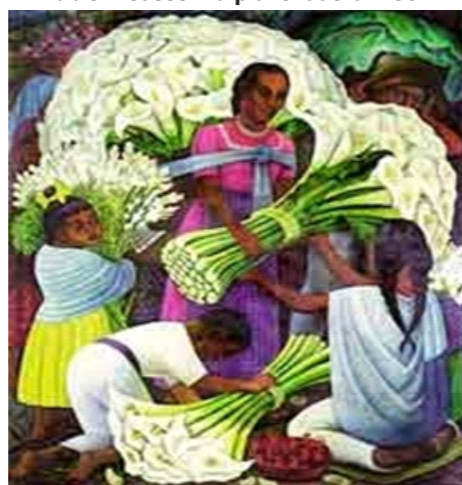
Diego Rivera. Vendedora de flores